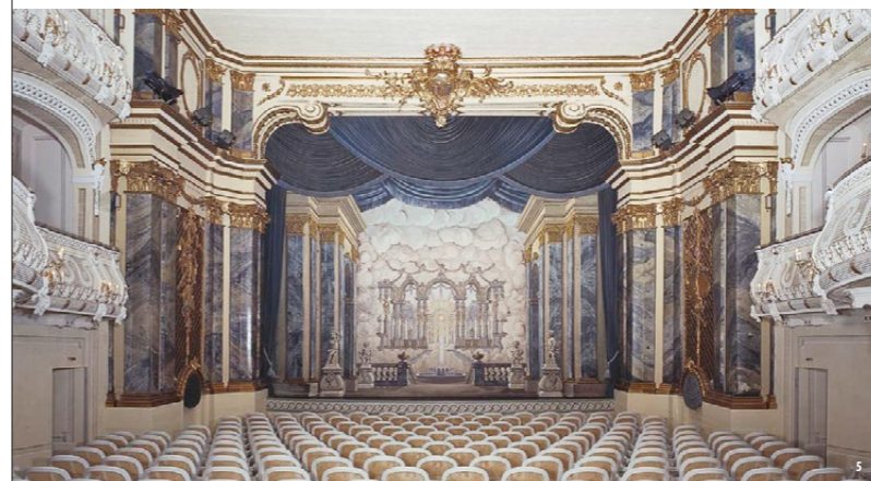
👑 🏛️ Стоит посмотреть в циркульных строениях: грандиозный дворцовый театр и лапидарий с ценными оригиналами и садовыми скульптурами (снимок слева)

Внутренние помещения дворца обставлены мебелью 18-ого и начала 19-го столетий. Совершенно особое место в дворцовом комплексе занимает придворный театр, расположенный в северном циркульном строении. Так называемый «дворцовый театр» еще и по сей день используется для представлений. Это самый старый сохранившийся ранговый театр в Европе.