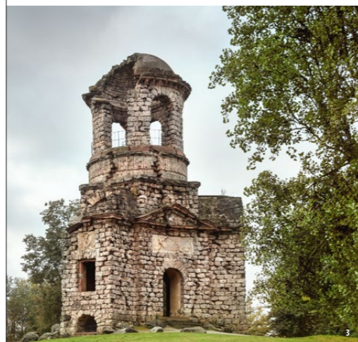
👑 🏛️ Храм Меркурия – это самое позднее сооружение, ориентирующееся по архитектуре на римские башни-гробницы

При курфюрсте Карле Теодоре дворец Шветцинген переживал времена своего самого большого расцвета. Карл Теодор поручил оформление дворцового комплекса самым авторитетным ландшафтными архитекторам того времени, в число которых вошел Николас де Пигаж (Nicolas de Pigage), а позднее и Фридрих Людвиг фон Скель (Friedrich Ludwig von Sckell).