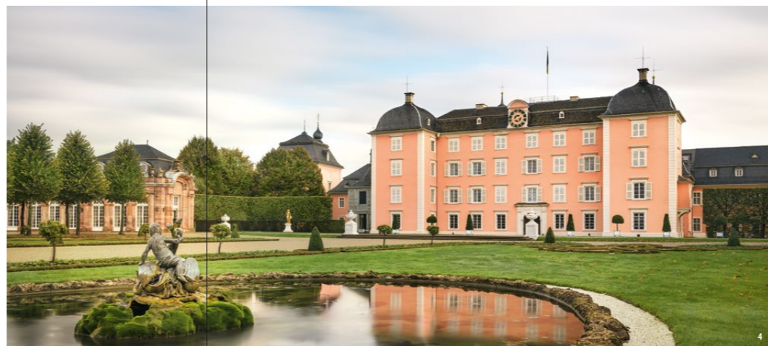
👑 🏛️ Вид от фонтана Ариона на главное строение: изначально на месте дворца располагался рыцарский замок, окруженный водой

Дворцовый сад Шветцинген является культурным памятником европейского масштаба: его чудесное и всегда необычное оформление определяют более 100 скульптур. Живописные произведения архитектуры увлекают посетителей в далекие и неизведанные миры. «Храм Аполлона» изображает греческого бога и искусства в ротонде за игрой на лире. Достояния внимания также купальня – приватное место отдыха с собственным садом, построенная по образцу итальянской виллы. В «Турецком саду» парка расположена мечеть – творение Николаса де Пигажа – самое большое строение такого рода в парке Европы. Однако здание позднего барокко, отделанное многочисленными восточными элементами, выполняло лишь декоративную функцию и не имело никакого религиозного значения.