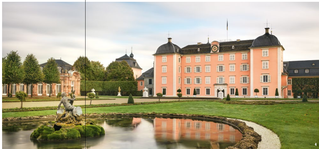
👑 从Arion喷泉遥望主建筑：宫殿的核心最初只是一座小型骑士水上城堡

施威琴根宫廷花园是欧洲的重要文化古迹：超过100座的雕塑为花园装饰得美轮美奂，艺术气息令人叹为观止。美丽如画的建筑仿佛让游客们置身于遥远而深具异国情调的世界。“阿波罗神庙”展示了希腊神话中光明和艺术之神在独立的圆形神庙中表演七弦琴的场景。另外，值得一看的还有澡堂，这是一座按照意大利别墅方式建造的带有自己花园的私人隐居处。最后，在“土耳其花园”中坐着由尼古拉斯·德·皮夏格 (Nicolas de Pigage) 设计的清真寺——这是在欧洲花园中唯一得以保存的此类型建筑。然而，这座带有许多东方元素的晚期巴洛克式建筑只有纯粹的装饰功能，并无任何宗教作用。