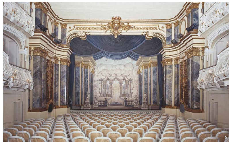
👑 圆形建筑中值得观赏的景观：宏伟的宫殿剧院和具有花园人物雕像之珍贵原件的石类珍品展览厅 (左图)

宫殿内部以18世纪和19世纪早期的古典家具装饰而成。该宫殿一大亮点是位于圆形建筑北部的选帝侯宫廷剧院。所谓的“宫殿剧院”至今仍用于演出。它是欧洲现存的最古老的楼座剧院。