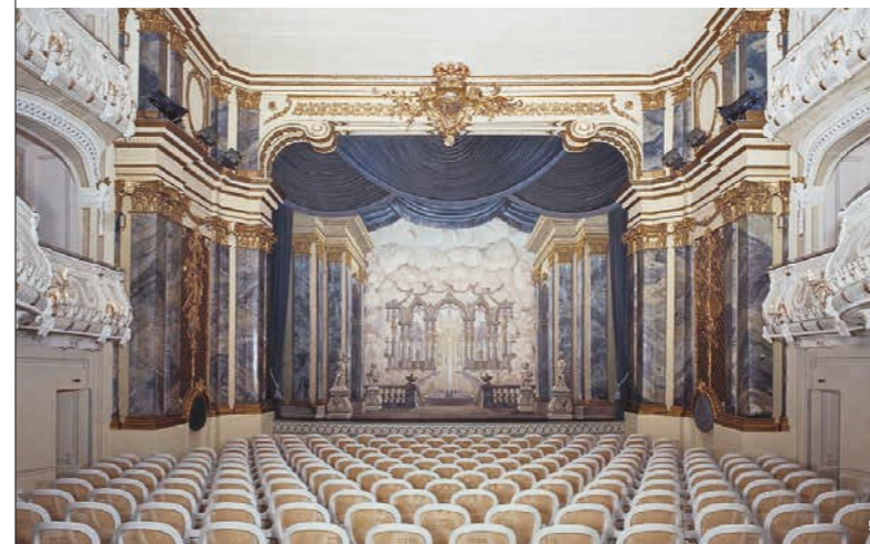
👑 🏛️ Para contemplar en los edificios circulares: el grandioso teatro del palacio y el lapidario con los maravillosos originales de las esculturas del jardín (figura izquierda)

Las salas del palacio están decoradas con muebles del siglo XVIII y principios del XIX. El Teatro de la Corte de los príncipes electores, situado en el edificio circular norte, es el lugar más destacado del palacio. El llamado «Teatro Rococó» sigue siendo en la actualidad escenario de distintas representaciones. Es el teatro de palcos más antiguo que se conserva en Europa.