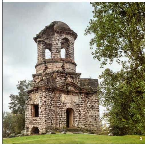
👑 🏛️ El Templo de Mercurio es el edificio más reciente del jardín, y su construcción recuerda a una torre funeraria romana

El Palacio de Schwetzingen vivió su época de máximo esplendor bajo el reinado del príncipe elector Carl Theodor, quien confió a importantes arquitectos de jardines de la época (entre ellos, Nicolas de Pigage y posteriormente Friedrich Ludwig von Sckell) el diseño del que rodearía su palacio. El proyecto, que se inició en 1749, permitió crear con el apoyo de artistas de renombre una obra de