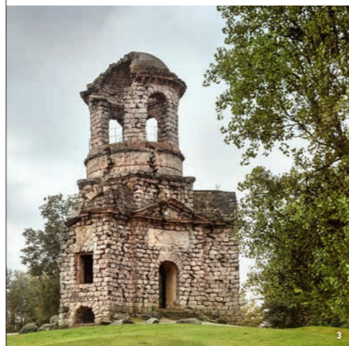
👑 De Mercuriustempel is het jongste gebouw in de tuin en is bouwtechnisch georiënteerd op een Romeinse grafpien

Onder keurvorst Carl Theodor beleefde kasteel Schwetzingen zijn hoogtijdagen. Hij gaf belangrijke tuinarchitecten uit zijn tijd zoals Nicolas de Pigage en later ook Friedrich Ludwig von Sckell opdracht om de tuin te ontwerpen. Zij begonnen in 1749 met de realisering van het grote project en brachten in samenwerking met de meest