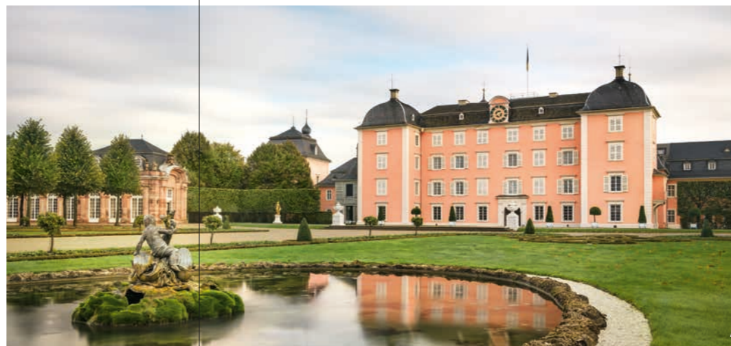
👑 Uitzicht vanaf de Arionfontein op het hoofdgebouw: De kern van het kasteel was oorspronkelijk een ridderlijke waterburcht

De kasteeltuin van Schwetzingen is een cultuurmonument van Europese betekenis: meer dan 100 beelden kenmerken het prachtige en steeds weer verrassende ontwerp. Pittoreske bouwwerken nemen de bezoeker mee naar verre en vreemde werelden. De ‘Apollotempel’ toont de Griekse god van het licht en de kunst ten in een vrijstaande ronde tempel terwijl hij de lier bespeelt. Bezienswaardig is ook het badhuis, een klein prieltje met een eigen tuin dat is gebouwd in de stijl van een Italiaanse villa. In de ‘Turkse tuin’ van het park tenslotte bevindt zich de tuinmoskee van Nicolas de Pigage – het enige bouwwerk van dit type dat tegenwoordig nog in een Europese tuin te vinden is. Het gebouw uit de late barok met zijn vele oriëntaalse elementen had echter een puur decoratieve en geen religieuze functie.