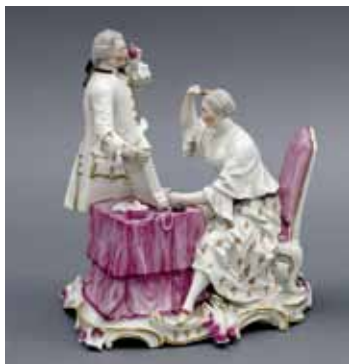
Porzellangruppe, um 1760