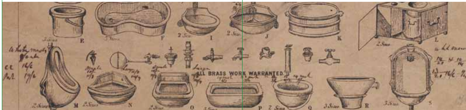
Musterblatt für Warenangebote, Wien nach 1871