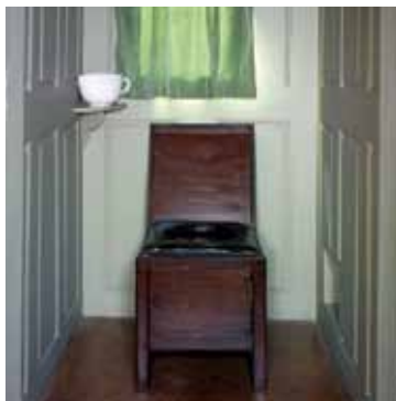
Retirade Schwetzingen, 18./19. Jh.