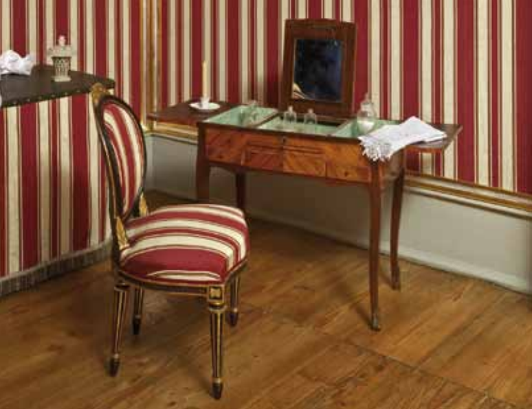
Toillettentisch in Form einer sog. „Poudreuse“, um 1765–1770