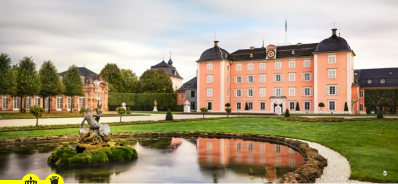
Vista de la fuente de Arión en el edificio principal: el núcleo del palacio fue originalmente un castillo caballeresco rodeado

las artes tocando la lira. La Casa de los Baños, un lugar de retiro privado con jardín propio al estilo de las villas italianas, también es de visita obligada. Por último, en el Jardín Turco del parque se encuentra la Mezquita de Nicolas de Pigage, la única obra de este tipo conservada en un jardín europeo. Este edificio con numerosos elementos orientales desempeñaba, sin embargo, una función meramente decorativa, sin connotaciones religiosas.